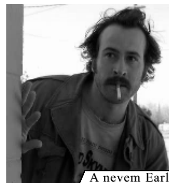
A nevem Earl

tam anyáttal , amely 2025-ben kezdődik, és benne Ted 20 évre visszamenőleg elmeséli gyermekeinek, hogy is ismerte meg édesanyjukat (hasonló történettel idén a mozik játszottak egy filmet, a Mindenképpen talánt ). Ezek mellett még a Comedy Central amerikai verziójának két legnépszerűbb műsora, a The Daily Show és a The Colbert Report is helyet kapott a csatormán, így hetente egy részt feliratosan nézhetnek azok, akiket valamennyire érdekel Amerika (és elsősorban a politikai helyzete), de a nyers adatok helyett humoros, könnyed formában tájékozódhatnak róla legszívesebben. Amúgy mindkét műsor ismerős lehet egyeseknek. A The Daily Show -t már adta itthon a CNN, és a műsorvezetője volt idén az Oscar-gála házigazdája és a The Colbert Report műsorvezetője nyerte meg két éve a nemrég átadott Megyeri híd névadási verse-